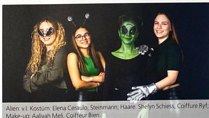
Alien: v.l. Kostüm: Elena Ceraulo, Steinmann; Haare: Shelyn Schiess, Coiffure Ryf; Make-up: Aaliyah Meli, Coiffeur Bieri