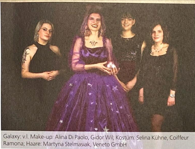
Galaxy: v.l. Make-up: Alina Di Paolo, Gidor Wil; Kostüm: Selina Kühne, Coiffeur Ramona; Haare: Martyna Stelmasiak, Veneto GmbH